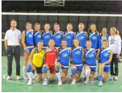
Unione Pallavolo Lucca U16 regionale

Le modifiche hanno migliorato la pallavolo secondo me, magari non cambierei troppo spesso e non farei troppe differenze tra i giovanili e i grandi (bagher per ricezione in U14 ad esempio).