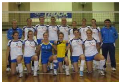
Unione Pallavolo Lucca B2 2011-2012

L'Unione Pallavolo Lucca partecipa al campionato nazionale di pallavolo femminile di serie B2 girone E.