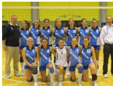
Unione Pallavolo Lucca U18 provinciale

Come dicevo il livello è ottimo, mi pare che le recenti World Cup stiano dimostrando che l'Italia c'è. Per fare forti rappresentative serve un bacino di utenza di qualità e formatori abili e evidentemente questo c'è, il bacino di utenza non è però spalmato in modo uniforme su tutto il territorio nazionale (è più facile trovare una ragazza che 1.90 con potenziale tra i 4 milioni di abitanti di Milano o tra i 70 mila di Lucca?) per cui ci sono per forza investimenti e attenzioni sperequate. Sulle piccole realtà ci potrebbero essere risorse da valorizzare. Quello che riesce a fare il calcio con gli osservatori nella pallavolo è ovviamente molto più ridotto.